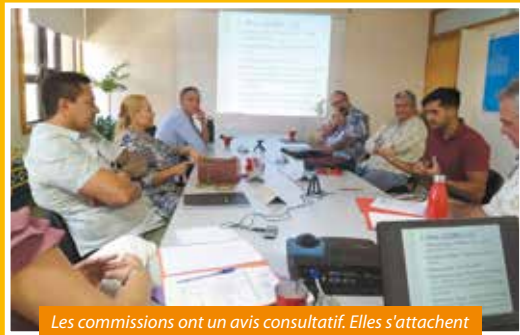
Les commissions ont un avis consultatif. Elles s'attachent à la pertinence culturelle et patrimoniale.

Plus de cent millions de Fcfp en moyenne sont attribués chaque année aux acteurs de la culture pour que celle-ci puisse vivre et rayonner. L'année 2020 a été particulière car la Covid-19 a empêché de nombreuses manifestations de se tenir. Pour autant, comment ces aides sont-elles distribuées ?