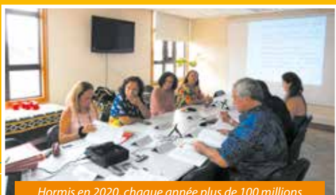
Hormis en 2020, chaque année plus de 100 millions de Fcfp sont attribués aux acteurs de la culture.