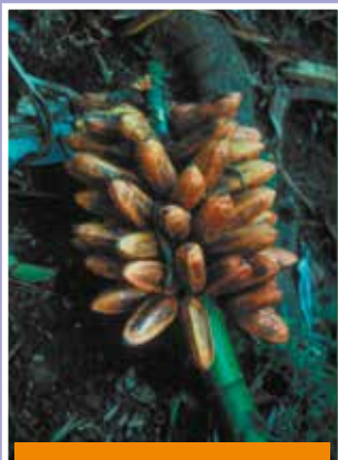
Tari mai'a Porapora, E. Hopu'u, Papeari, 2008