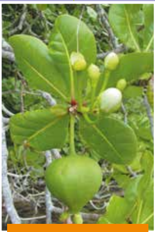
Mā'a e 'umoa o te tumu hotu, J-F. Boutaud, Tahiti, 2003

E tu'u i te tumu mei'a i roto i te auahi, e pātia i te tipi i roto nō te ha'apa'ari. E ravehia te tumu mai'a 'āpi, e tūpa'ipa'ihia, e tāpirihia i ni'a i te 'iri nō te ha'amahu i te toto. ♦