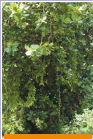
Tumu hotu, N. Montillier Tetuanui, Paopao, Mo'orea, 2007