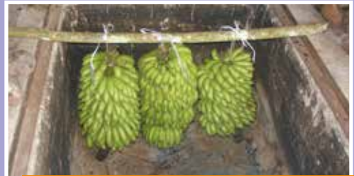
E toru tari mā'a tu'uhia i roto i te pōiri e te ve'ave'a o te 'āpo'o tāpō'ihia nō te ha'apara'oi'oi ia rātou nō te fa'aineine i te tahi tāmā'ara'a rarahi, E. Hopu'u, Papeari, 2007

E fa'a'ohipahia ei rā'au fēfē, patia nohu, ma'i 'iri ; e orohia te mā'a, e tu'uhia i roto i te 'āpo'o i muri i te pararira'a o te fēfē.