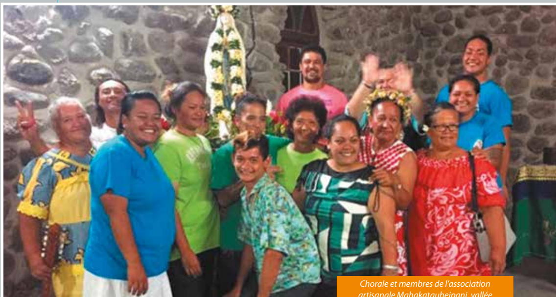
Chorale et membres de l'association artisanale Mahakatauheipani, vallée de Hapatoni, Tahuata, Marquises, 2017.

HIRO'A JOURNAL D'INFORMATIONS CULTURELLES