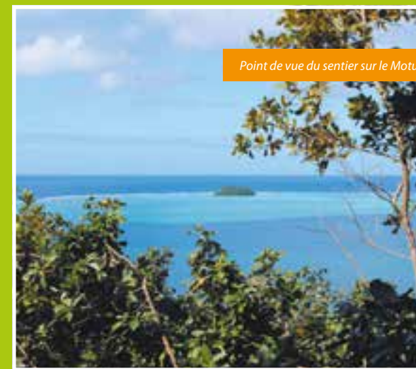
Point de vue du sentier sur le Motu Atara