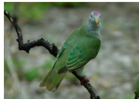
Ptilope des Tuāmotu ( Ptilinopus coralensis ) 'Ō'ō, kōkō, kūkūpa

La Société d'Ornithologie de Polynésie, Manu a été créée en 1990 par quelques passionnés d'oiseaux. En 20 ans elle a augmenté régulièrement le nombre de ses adhérents et a un réseau de correspondants dans tous les archipels. Elle a d'abord orienté son activité vers une meilleure connaissance des oiseaux par des visites de terrain et la diffusion de l'information par son bulletin Te Manu et des conférences. Depuis une dizaine d'années, son activité orienté vers la conservation active des espèces et la restauration des habitats, a plus que décuplé avec des programmes dans tous les archipels de Polynésie française... Elle est reconnue d'intérêt général en Polynésie française et est devenue récemment membre à part entière de BirdLife International , fédération d'associations du monde entier oeuvrant pour la conservation des oiseaux et de leur environnement.