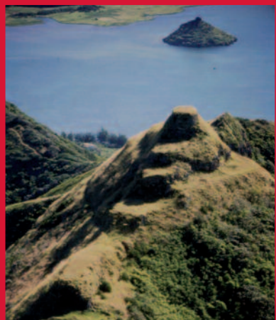
Rapa : Australes, île Rapa, Pa ou fortifications de Rapa.

Le patrimoine ne se résume pas aux marae , aux tiki ou au 'ori tahiti . C'est aussi des photographies, des diapositives, bref, tous documents témoignant de la Polynésie. Le fonds du service de la Culture et du Patrimoine contient 62 000 documents iconographiques inventoriés, comprenant des images des sites archéologiques, légendaires et historiques de toute la Polynésie, ainsi que des événements patrimoniaux. En 2010, 14 500 images étaient numérisées, permettant de réserver les originaux, d'ouvrir leur contenu et de les communiquer au public. En effet, la numérisation permet de valoriser ces merveilleux trésors en les dévoilant à travers des expositions « hors les murs ». A très bientôt place Vai'ete donc ! ♦