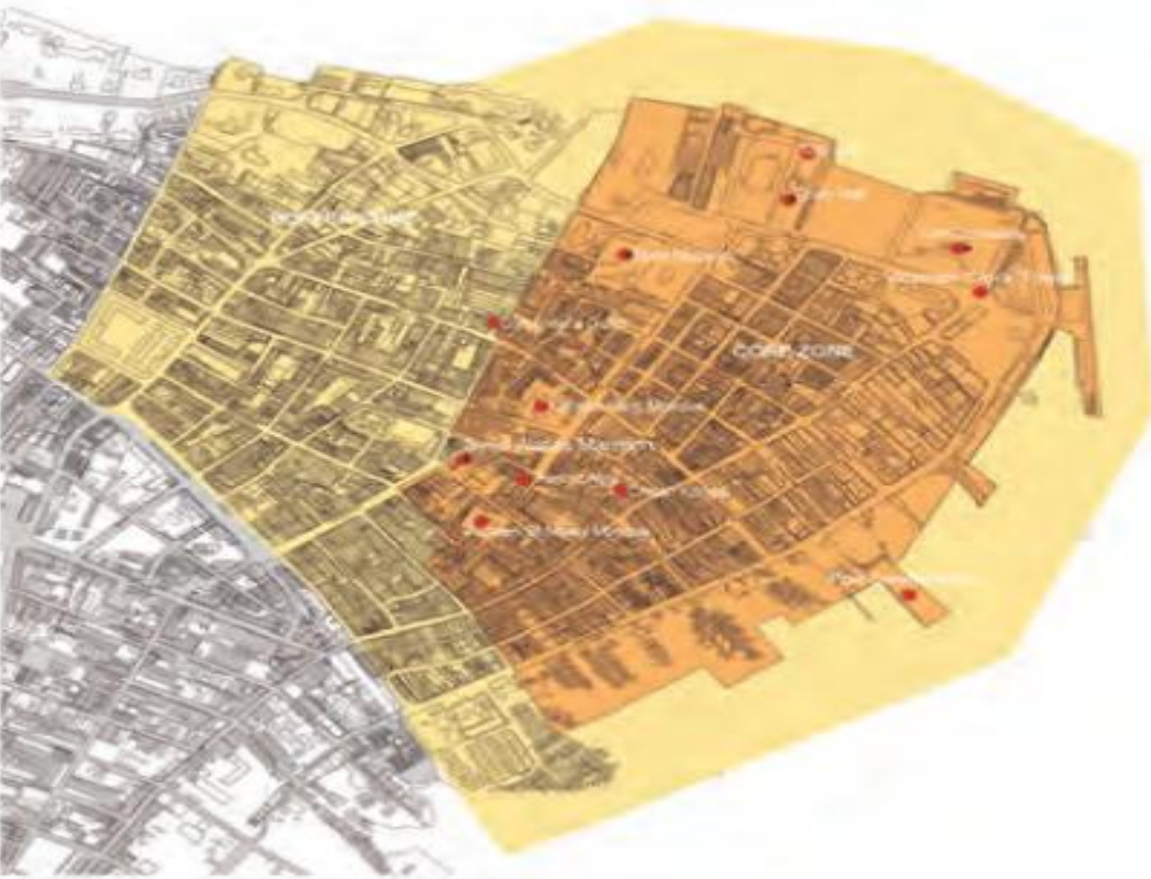
Villes historiques du détroit de Malacca