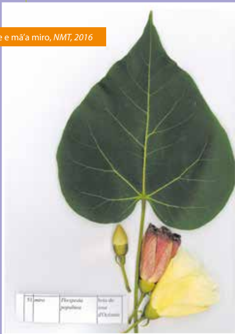
Rau'ere e mā'a miro, NMT, 2016

Teie te tahi nau rā'au e tupu nei nā ni'a i nā 'e'a to'opiti nō 'Ōpūnohu i Mo'orea- Te ara-tupuna 'e te 'e'a nō te 'āro'a Pu'uroa - i fāna'o i te tahi mau paruai fa'a'ite'itera'a i tō rātou fa'a'ohipara'a i roto i te orara'a ā te Mā'ohi, i te mātāmua iho ā rā.